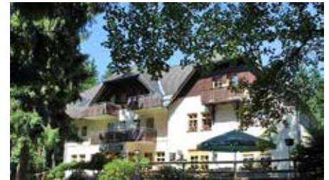
Tag der offenen Tür Berggasthof Kuhberg, (Beitrag S. 2).