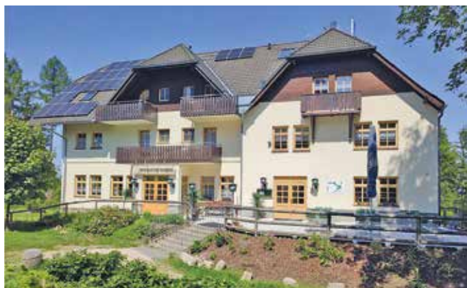
Berggasthof Kuhberg.

Ein idealer Ort ist der Kuhberg somit insbesondere für Familientreffen und Feierlichkeiten. Übernachtungsmöglichkeiten sind ein großer Vorteil, wenn Gäste von weither anreisen und das eigene Zuhause keine Möglichkeiten für Übernachtungsgäste bietet. Ein Gemeinschaftsraum mit angrenzender Terrasse und der Garten sorgen für ausreichend Platz und die Ruhe und Abgeschiedenheit