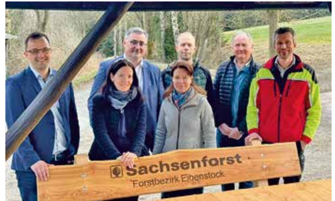
Übergabe der neuen Sitzgruppe.

en Sitzgelegenheit. Auch andere Schäden wurden beseitigt und das Kneipp-Becken für die neue Saison gereinigt. Auch mehrere Hinweise auf die Täter und den Tathergang sind bei den Ermittlungsbehörden bereits eingegangen, die nun weiterverfolgt werden.