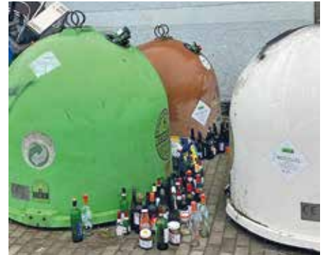
Volle Container.

Unsere herzliche Bitte – melden Sie der Gemeindeverwaltung, wenn die Container voll sind und gedulden Sie sich einige Tage, bis wir die Entsorgungsfirmen mit der Leerung beauftragt haben und stellen Sie ihr Leergut nicht einfach daneben ab. Danke für Ihr Verständnis!