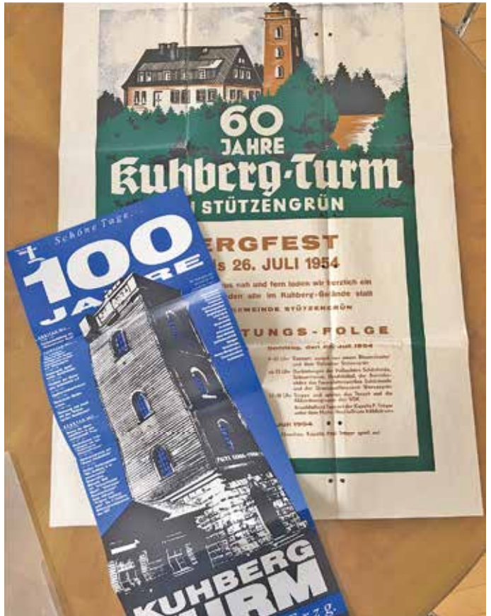
Plakate 60 / 100 Jahre Kuhberg.

1881, 3. Juni - Die Perle unserer nächsten Umgebung, der "Prinz-Georg-Turm", hat sich auch in diesem Jahr schon recht lebhaften Besuches von nah und fern zu erfreuen gehabt. Für die nächste Zeit, insbesondere für die Pfingstfeiertage, steht bereits wieder der Besuch ganzer Kooperationen und Gesellschaften in Aussicht, und wenn nicht alle Anzeichen trü-