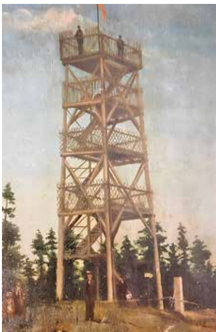
Hölzener Aussichtsturm.

...Fortsetzung folgt in der Mai Ausgabe 2024 des Gemeindeanzeigers